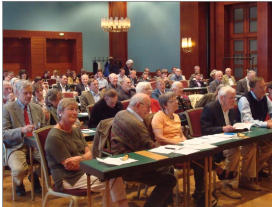
Wissenschaftliche Tagung der Forschungsgemeinschaft 20. Juli 1944, der Stiftung 20. Juli 1944, des Rheinischen Merkurs, der Hessischen Landeszentrale für Politische Bildung, und der Technischen Universität Chemnitz