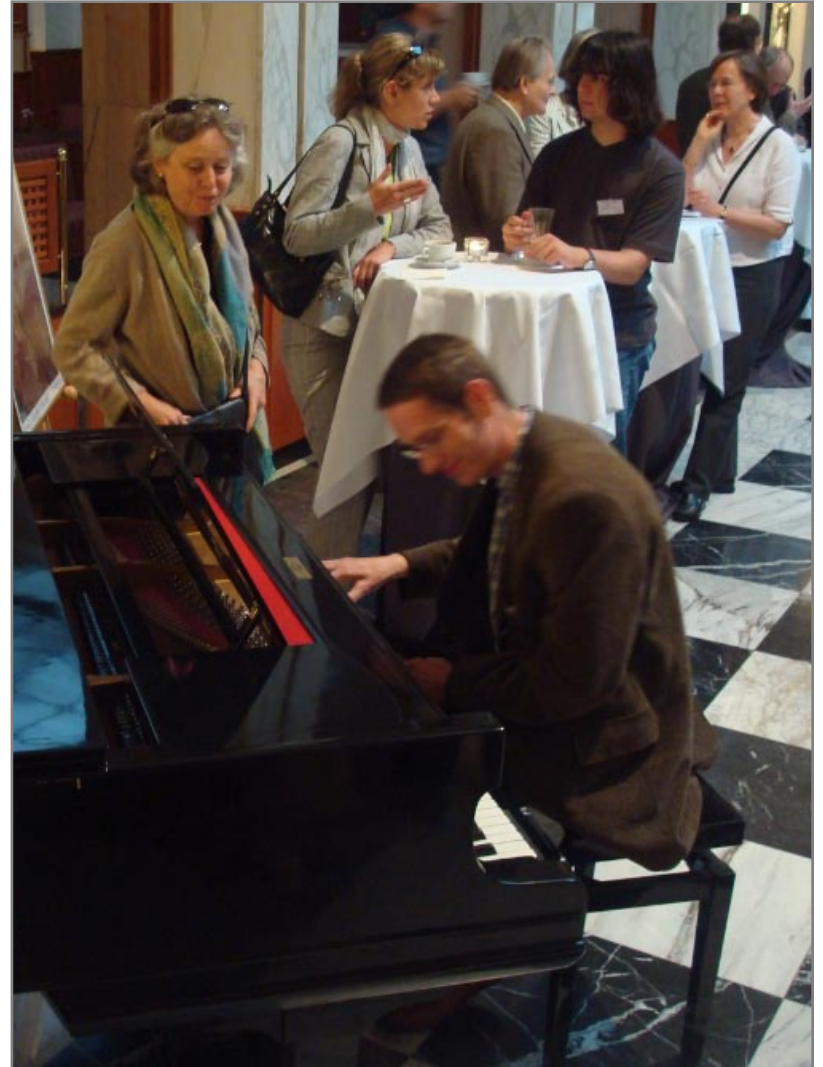
Der Pianist Entspannung in der Pause