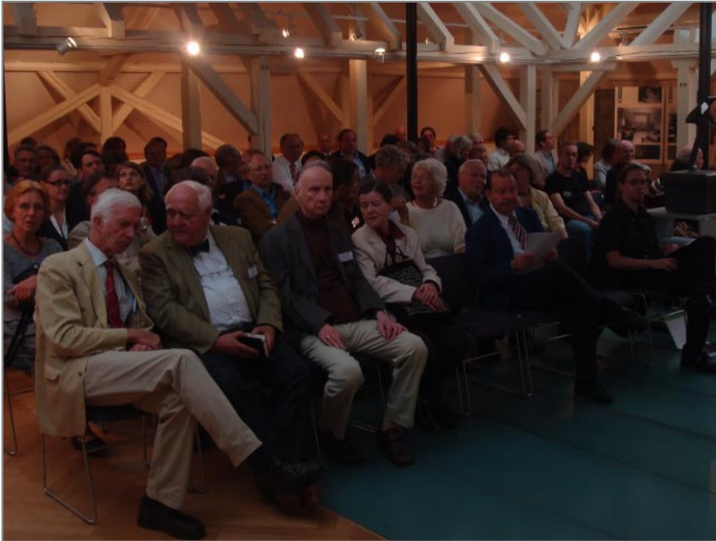
Abendvortrag in der Villa Esche